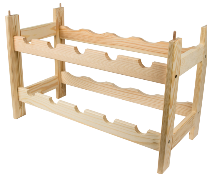
Ściana półek z wycięciem na korpus butelki

3. Po zamontowaniu 2 ścian leżni regał jest prawidłowo złożony.